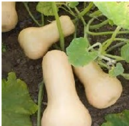
Courge Butternut Berry