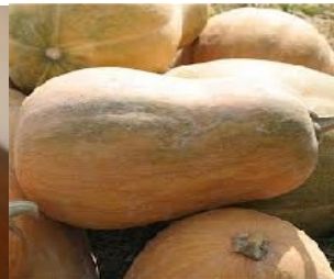
Courge sucrine du