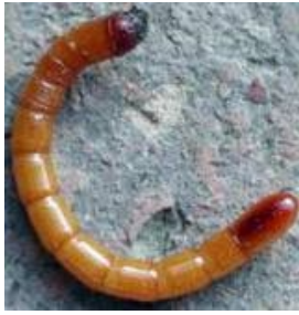
Larve de taupin