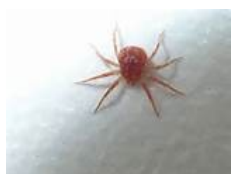
photo d'araignée rouge

Pour les graines de carottes, ajouter du charbon de bois écrasé ou du marc de café contre les araignées rouges.