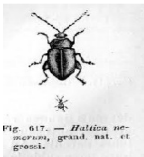
Fig. 617. — Haltica nemorum , grand. nat. et grossi.