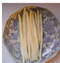
turions de l'année suivante