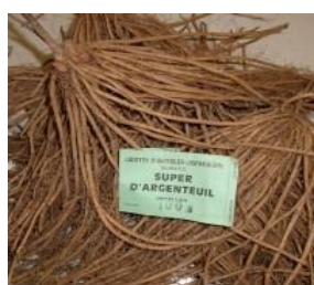
griffes de deux ans

Pour limiter leur nombre, mettre des feuilles de journal au sol, secouer les asperges et froisser rapidement la feuille de journal (attraper, c'est gagné).