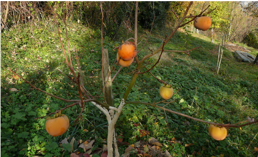
Le Kaki issu du plaqueminier a susciter quelques interrogations ; quelle difference entre le kaki et le kaki pomme ??? En attendant vos réponses c'est le moment de le déguster, riche en sucre (15%) en fibres (2,5g/100g) en vitamines C (16mg /100g) en provitamine A riche en propriétés antioxydantes et des oligoéléments. Moi j'adore...