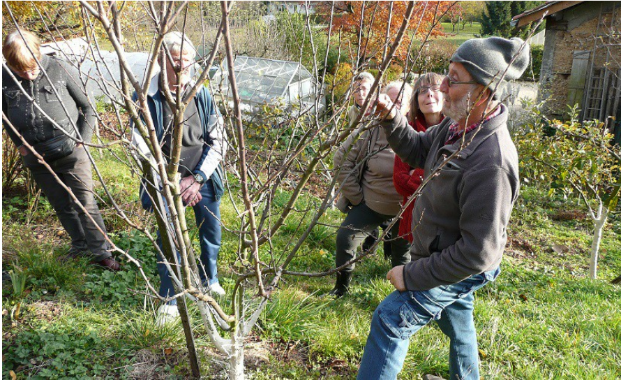
Taille des arbres avec sous les yeux un superbe prunier