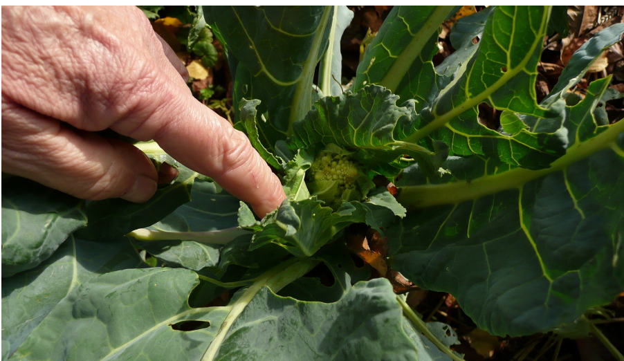
Petit bébé Romanesco