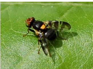
mouche de la cerise

La mouche va pondre sur les feuilles ou les fruits, les œufs vont éclore et la larve pénétrera dans les fruits. Les plaques jaunes enduites de glue sur les deux faces seront pendues dans les branches, elles attirent les mouches qui viendront se coller dessus.