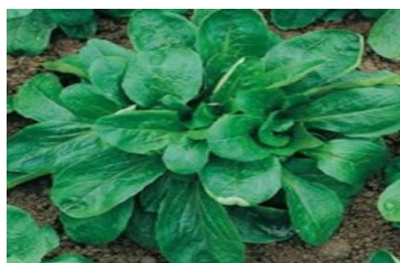
Mâche grosse graine