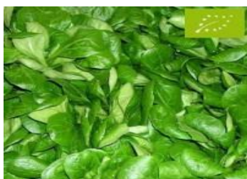
mâche Vite bio

Nous avons juste à les récupérer. Elles ont toujours gardé cet esprit sauvage, on peut les semer à la volée sur un emplacement non préparé. Semer des mâches à grosses graines pour le premier semis, les mâches de Cambray sont plus résistantes au froid ou encore la mâche Vite bio qui résiste au froid et aux maladies.