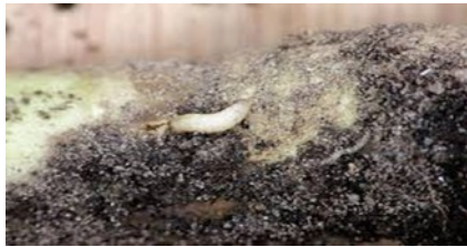
larve de la mouche des semis