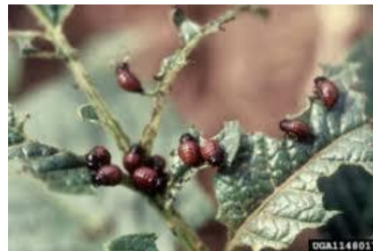
Les larves au travail

Ensuite, elles s'enfouissent quinze jours sous terre entre 4 et 20 centimètres de profondeur pour se nymphoser. Ils passent l'hiver sous terre et sortent aux premiers beaux jours et le cycle recommence. Ils ont des ailes et peuvent se déplacer de jardins