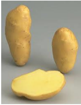
Belle de Fonteney