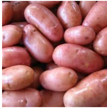
Chérie peau rose

L'arrosage : Les pommes de terre que je plante dans la serre froide sont arrosées en fonction de la chaleur et celles plantées en pleine terre le sont après le buttage. Ensuite, je paille entre les rangs et je traite deux fois à la bouillie bordelaise contre le mildiou. Photo ci-dessous.